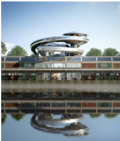
[3] FENIX, artist impression, MAD Architects

[2] FENIX water front, artist impression, MAD Architects