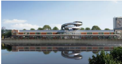
[2] FENIX, waterfront, artist impression, MAD Architects

[1] FENIX, first sketch, Ma Yansong, summer 2018