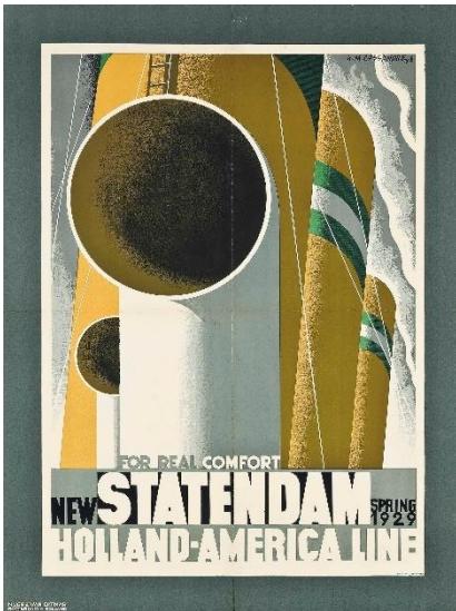
[6] A.M. Cassandre, The New Statendam, 1928, 89,5 x 78 cm