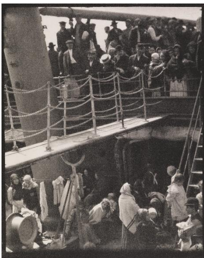
[7] Alfred Stieglitz, The Steerage, 1907 (print: 1915/1916)