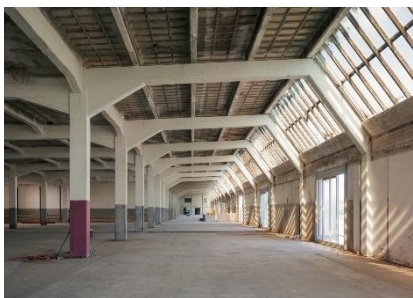
[4] Eerste verdieping FENIX, voor aanvang restauratiewerkzaamheden.

[3] FENIX, artist impression, MAD Architects